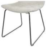
1094 Metallgestell schwarz matt Standard