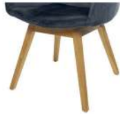
1096 Holzgestell Eiche geölt (gegen Aufpreis)