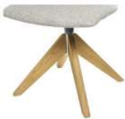
1098 Spinnenholzfuß drehbar Eiche geölt (gegen Aufpreis)