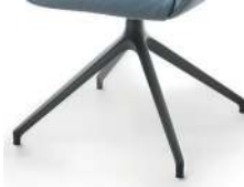
1099 Spinnenfuß drehbar schwarz matt (gegen Aufpreis)