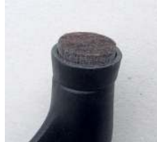
Filzgleiter (gegen Aufpreis)