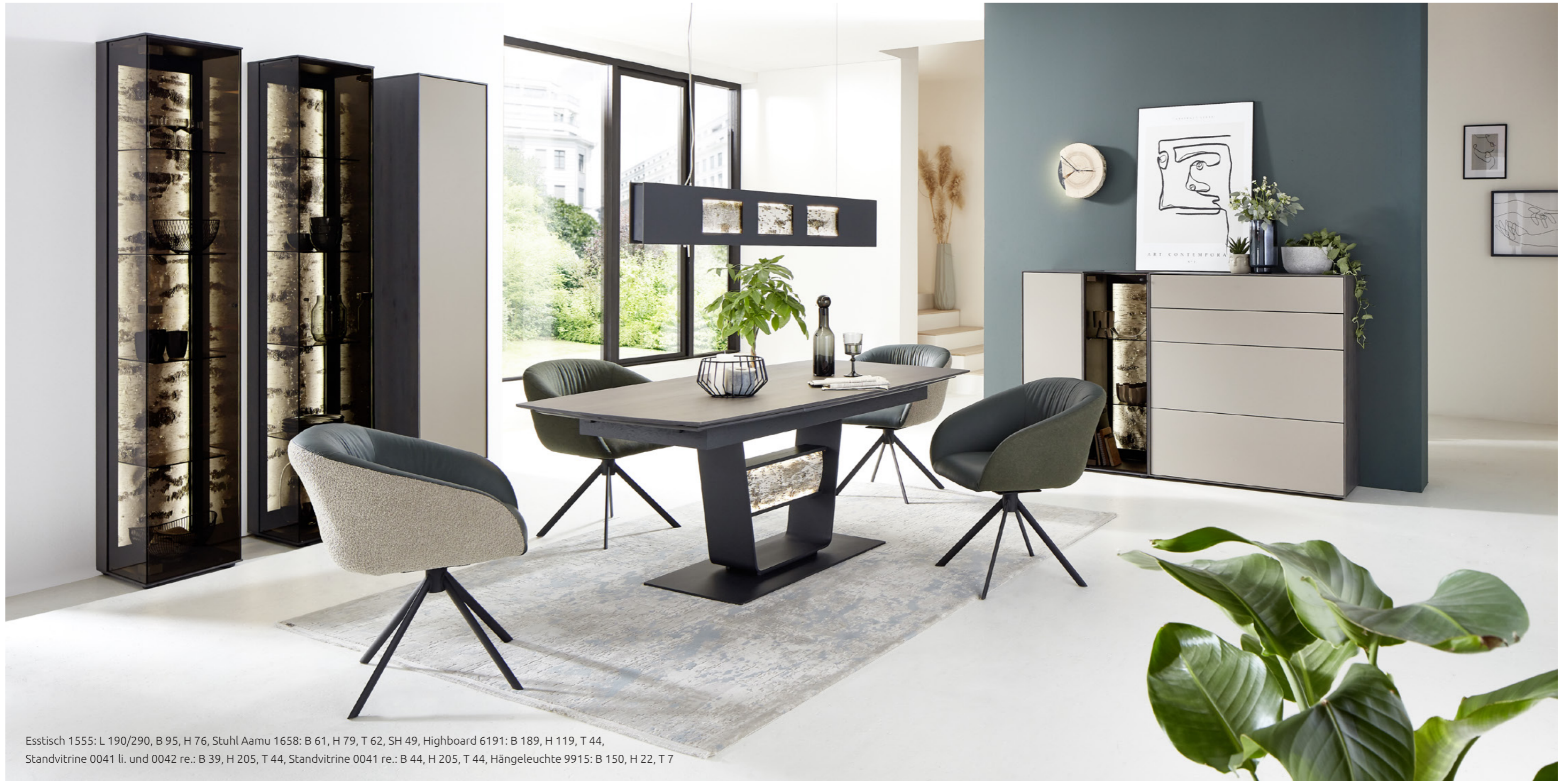
Esstisch 1555: L 190/290, B 95, H 76, Stuhl Aamu 1658: B 61, H 79, T 62, SH 49, Highboard 6191: B 189, H 119, T 44, Standvitrine 0041 li. und 0042 re.: B 39, H 205, T 44, Standvitrine 0041 re.: B 44, H 205, T 44, Hängeleuchte 9915: B 150, H 22, T 7