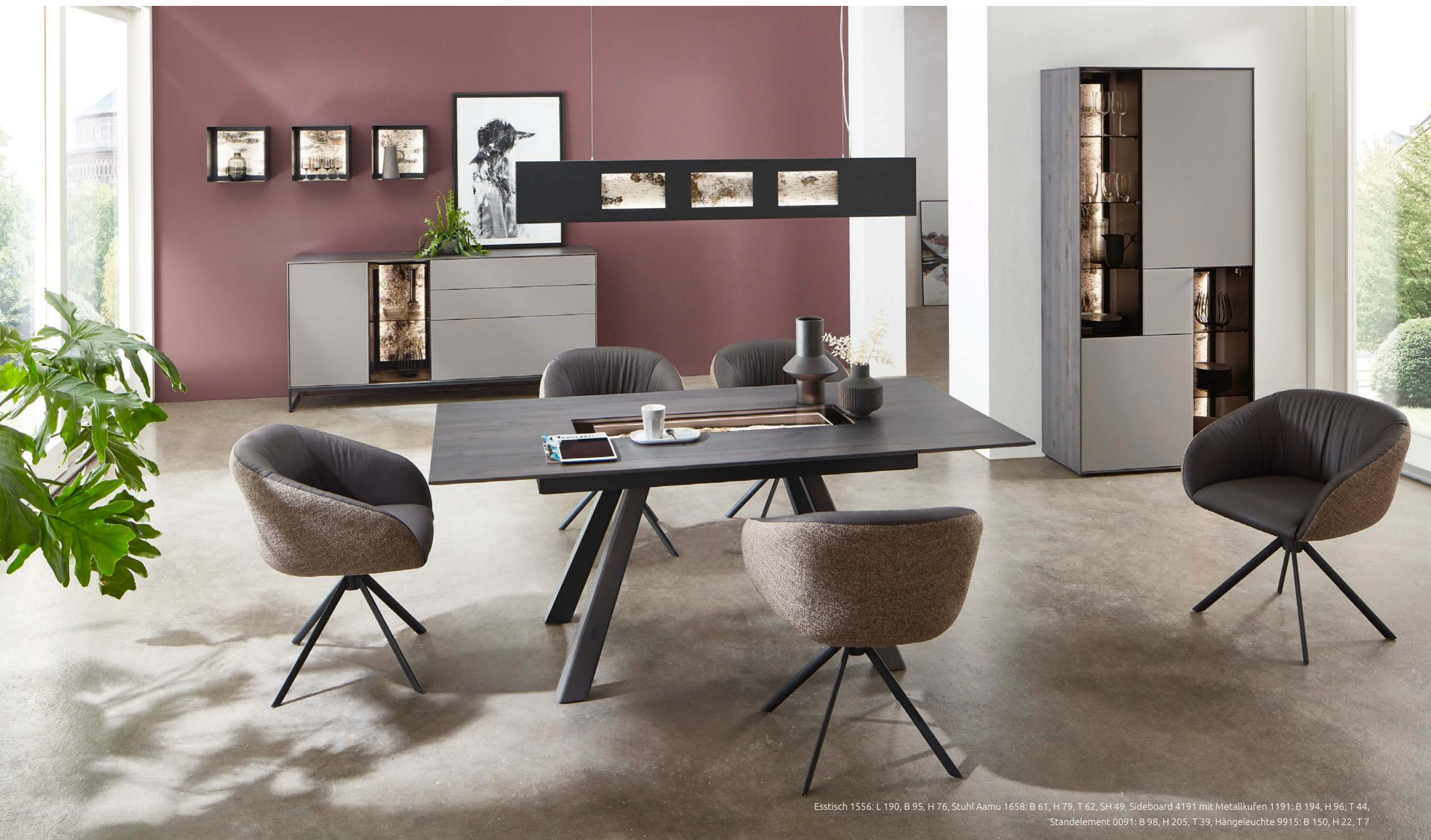
Esstisch 1556: L 190, B 95, H 76, Stuhl Aamu 1658: B 61, H 79, T 62, SH 49, Sideboard 4191 mit Metallkufen 1191: B 194, H 96, T 44, Standelement 0091: B 98, H 205, T 39, Hängeleuchte 9915: B 150, H 22, T 7