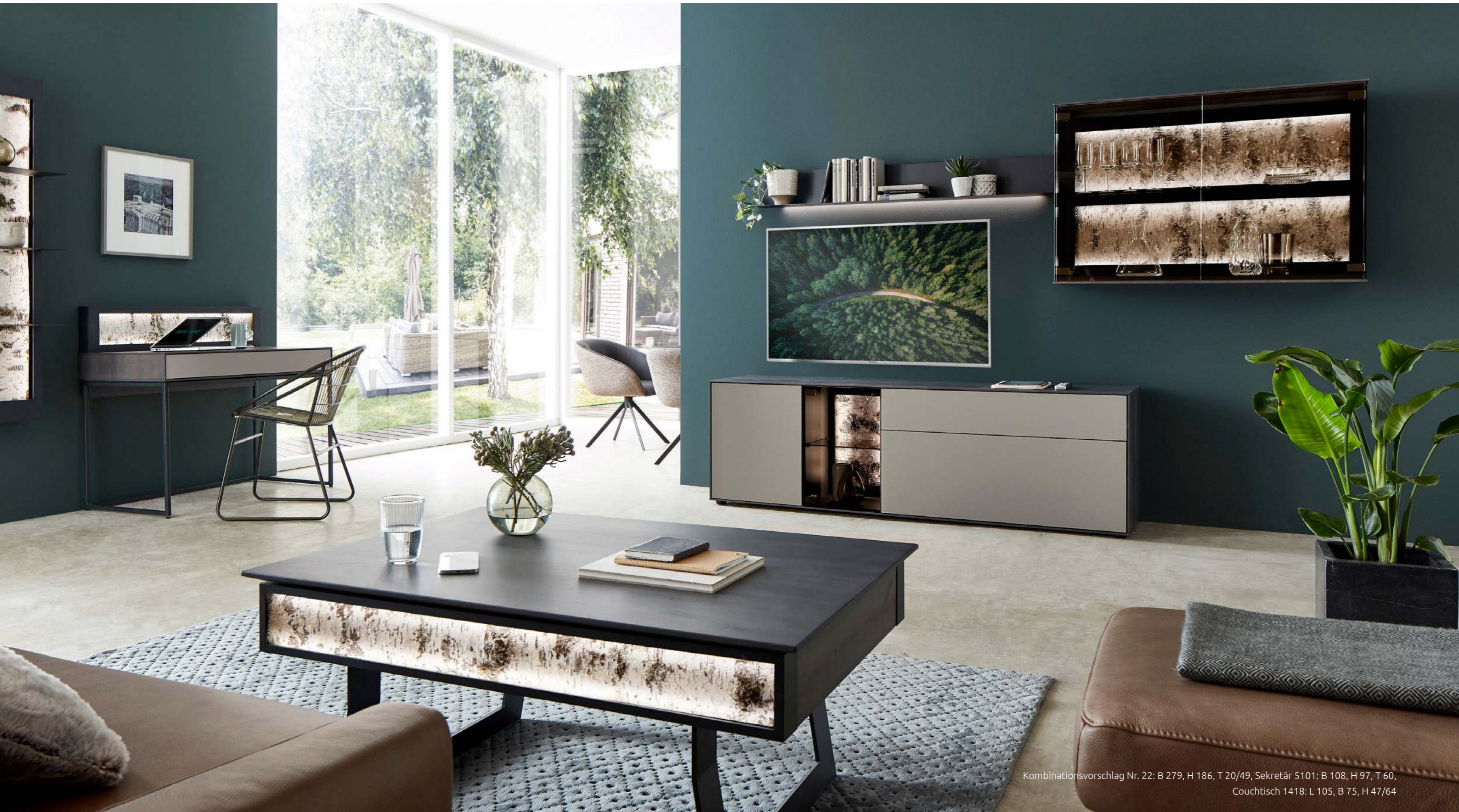
Kombinationsvorschlag Nr. 22: B 279, H 186, T 20/49, Sekretär 5101: B 108, H 97, T 60, Couchtisch 1418: L 105, B 75, H 47/64