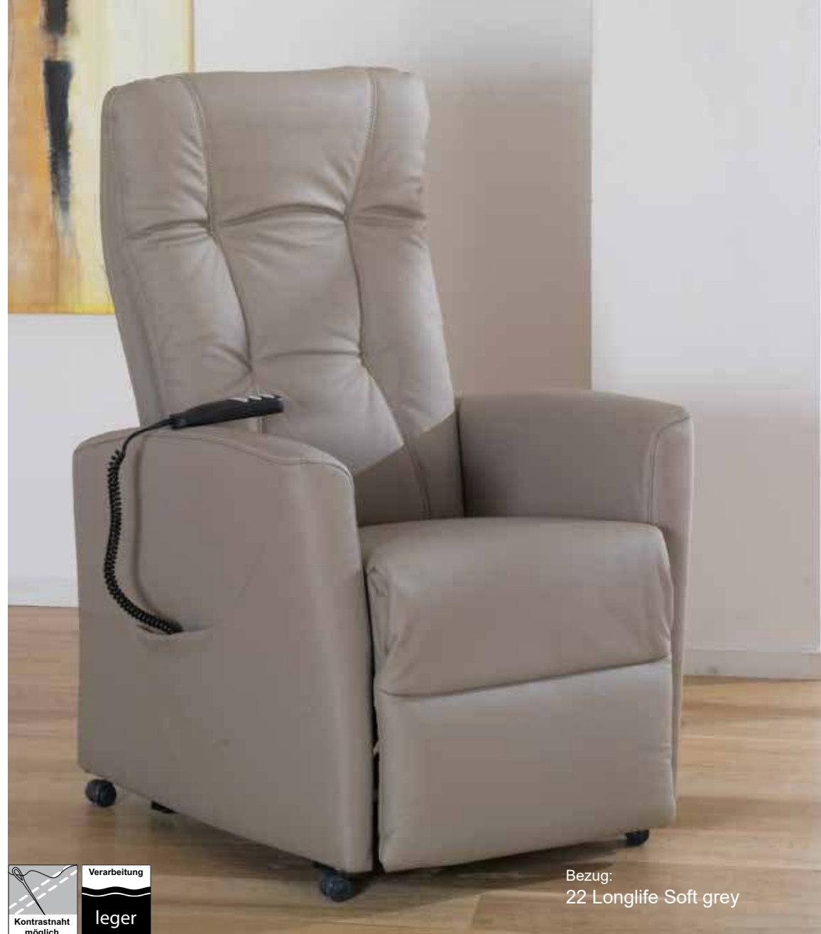
Variante 28 B/T/H: 81/85/110