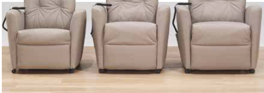
Variante 25 B/T/H: 76/83/105