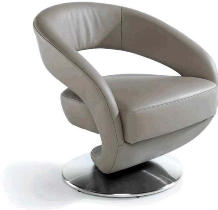
1A Drehsessel mit Drehteller in Edelstahloptik gebürstet